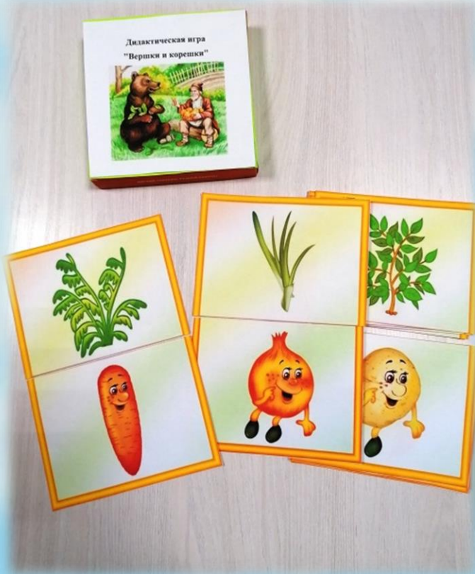
«Вершки и корешки»